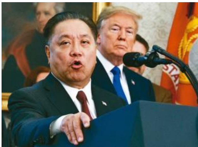
博通執行長陳福英（左）去年11月在白宮宣布將把公司總部從新加坡遷往加州，美國總統川普在旁聆聽。