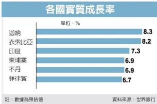
圖表 / 經濟日報提供