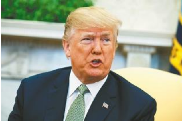
美國總統川普要求白宮幕僚對規模600億美元的中國進口品課徵關稅。