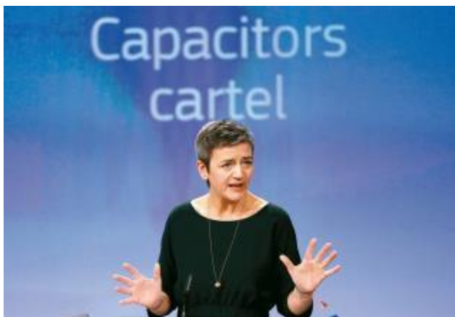
歐盟反壟斷執委瑪格麗特·維斯塔格21日在記者會表示，歐盟懲罰八家壟斷電容器市場的日本企業。路透