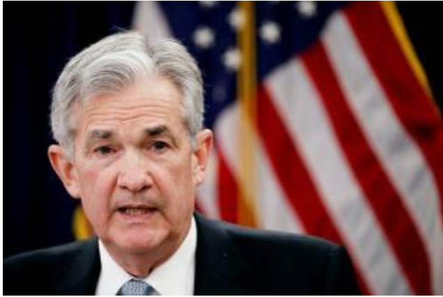
美國再度升息，圖為Fed主席鮑威爾。