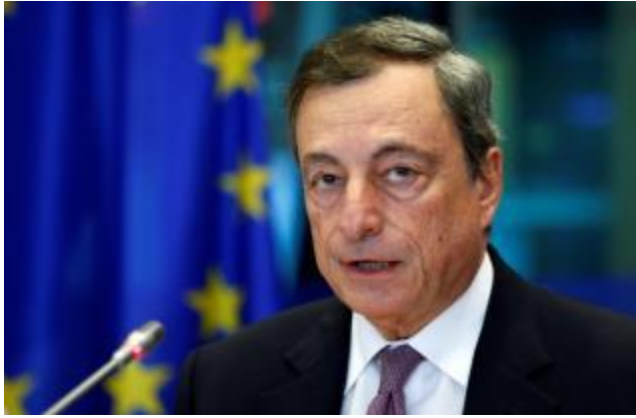
歐洲央行14日召開決策會議，市場預料歐央將開始討論如何終結構債計畫。圖為歐央總裁德拉吉。